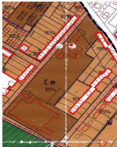
Uitsnede uit de plankaart

Beide percelen (inclusief het perceel Bosweg 3 waarop een woning is gelegen en welke buiten de werking van dit besluit valt) hebben een gezamenlijk bebouwingspercentage van 35%. In het bestemmingsplan dat nu nog geldig is, zijn geen nader aangeduide bouwvlakken aangegeven. Nu het Staring College is gesloopt, is dit bebouwd oppervlak komen te vervallen en telt derhalve niet meer mee in het bebouwd oppervlak. Dit zou theoretisch betekenen dat zowel het terrein van het voormalige Staring College als het terrein van St. Jozef bebouwd kunnen worden tot 35% van het gezamenlijke perceel. Dit zou een uitbreiding kunnen inhouden van de bebouwing van ruim 7.000 m 2 .