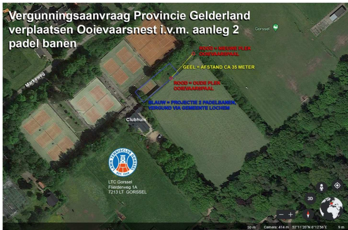
Figuur 1. Locatie plangebied waar aanleg padelbanen is voorzien en de te verplaatsen ooievaarspaal aan de Flienderweg 1a te Gorssel.