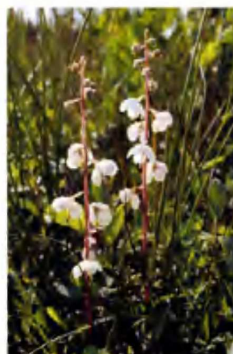
Van links naar rechts: Moeraswespenorchis (5.1.2e 5.1.2e); Brede orchis (5.1.2e 5.1.2e) en Rondbladig wintergroen (5.1.2e 5.1.2e)