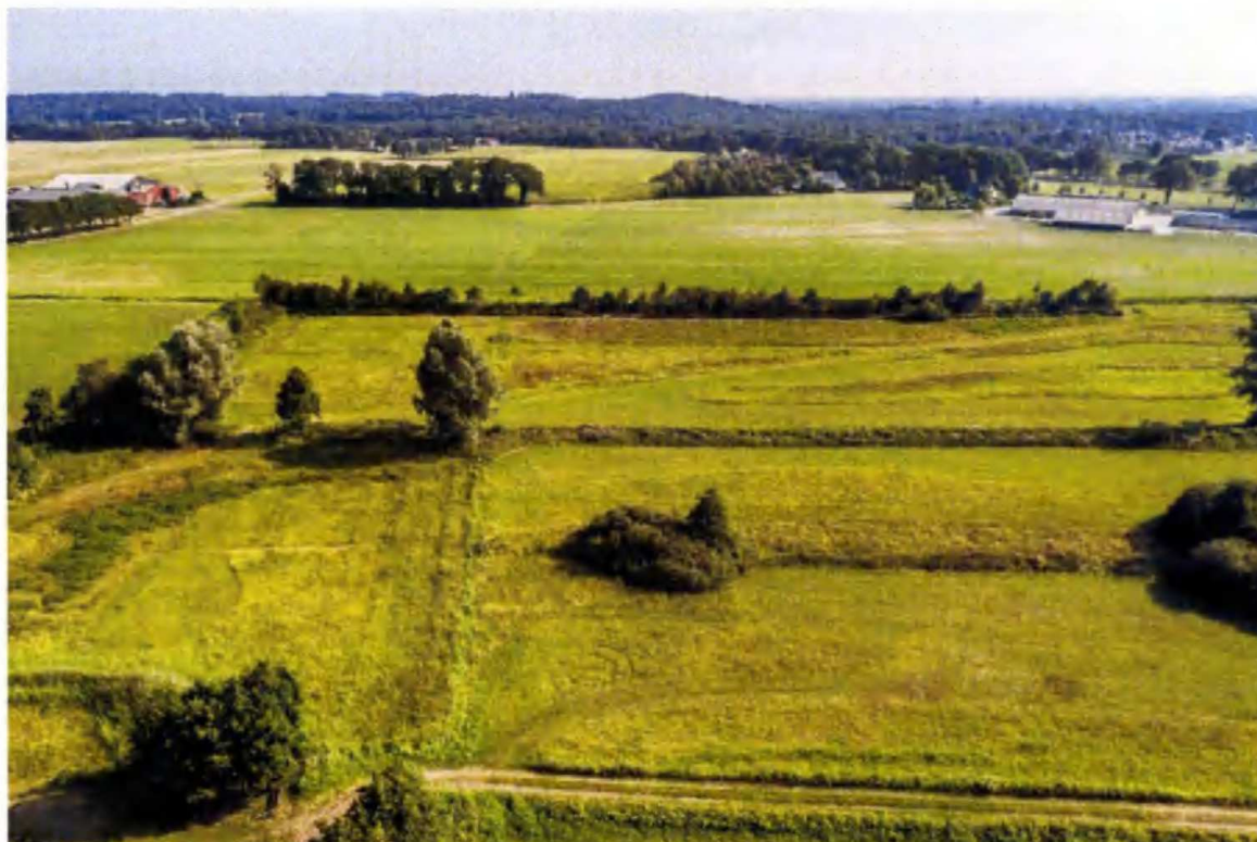
Gefaseerd maai-beheer Hagenbeek (5.1.2e 5.1.2e, luchtbeeld.nl)