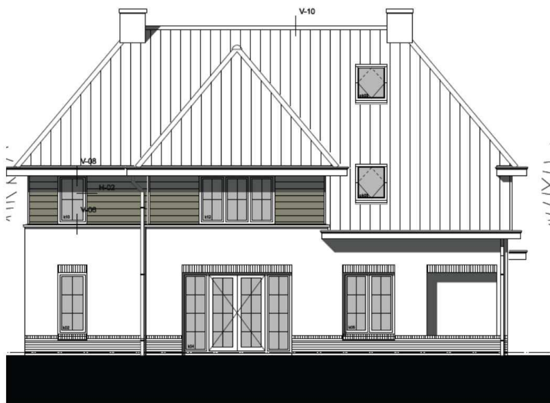
Figuur 3: Voorgevel nieuwe woning