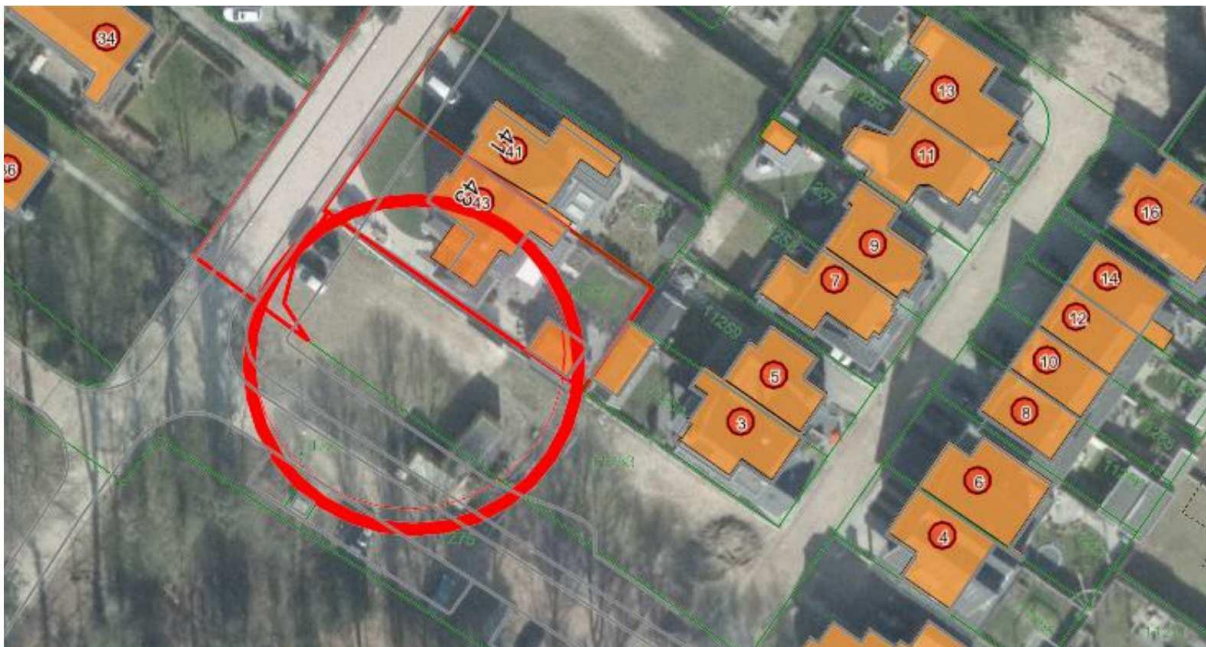
Figuur 1: Luchtfoto perceel Bosweg 45

Het plangebied ligt aan de zuidelijke rand van Lochem, op de hoek van de Bosweg en de Burgemeester Wittewaalweg.