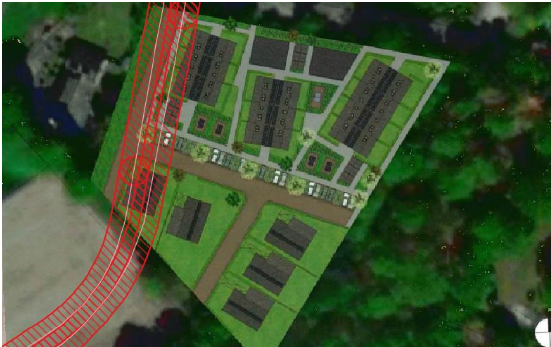
Figuur 3: buisleidingen en belemmeringsgebieden t.o.v. het plangebied

Tot slot wordt geadviseerd, mocht het initiatief doorgang vinden, om de Gasunie bij het plan te betrekken. In de beoogde situatie wordt namelijk dicht op de buisleiding gebouwd wat gevolgen kan hebben voor de veiligheid van de omgeving. Het is daarom goed om de Gasunie een advies te laten uitbrengen over dit plan.