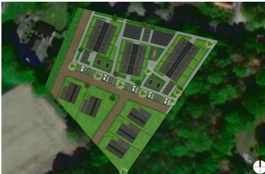
Figuur 1: mogelijk plan woningbouw Lochemseweg 1a Harfsen

De locatie Lochemseweg 1a in Harfsen (perceel; AMN00, B, perceelnummer 2753) is een zoekgebied voor de uitbreiding van woningen. Een concreet plan ligt er nog niet, maar een initiatiefnemer is bezig de mogelijkheden te verkennen. Ten behoeve van deze verkenning heeft de initiatiefnemer onderstaande schets aangeleverd (zie figuur 1).