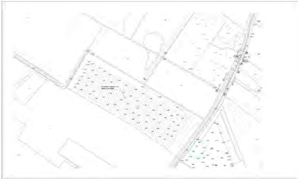
Figuur 1 projectgebied Hagenbeek